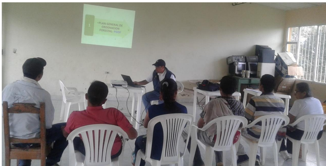
Ilustración 30. Participantes de los talleres – Vereda Colombia y San José

algunos propietarios han pensado en vender y migrar a otras zonas; igualmente reconocen los beneficios a largo plazo del proyecto, los cuales conllevarán a un aumento en la fauna y el recurso agua (según la percepción de los asistentes). No mencionan aspectos negativos. Como aspecto a mejorar en el proyecto, se menciona poder realizar más talleres en otras veredas para abarcar a más personas que estén comprometidas con el cuidado del medio ambiente.