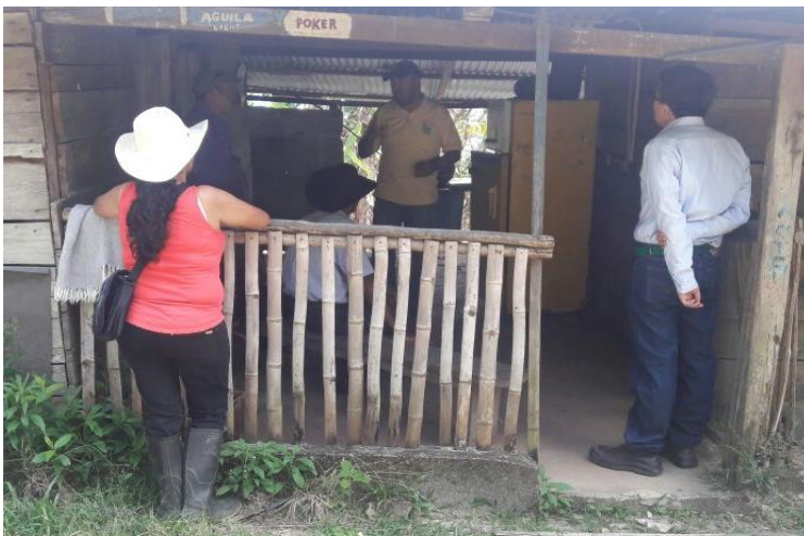
Ilustración 50. Participantes de los talleres – Vereda Vara Santa