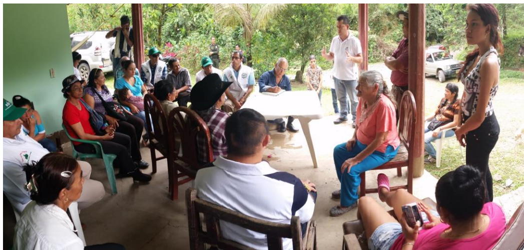
Ilustración 46. Participantes de los talleres – Vereda Carbonera