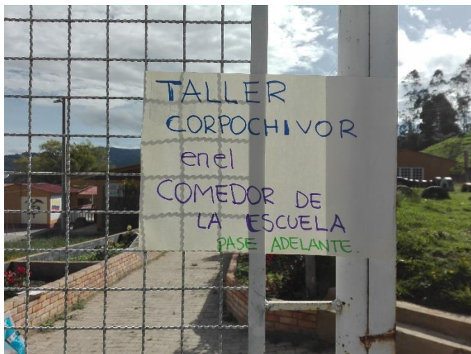
Ilustración 14 Cartel informativo sobre lugar de la reunión

cual, se tomó nota de modificar el día de la reunión y hora, proponiendo los días lunes en el pueblo, debido a que coincide con el día de mercado.