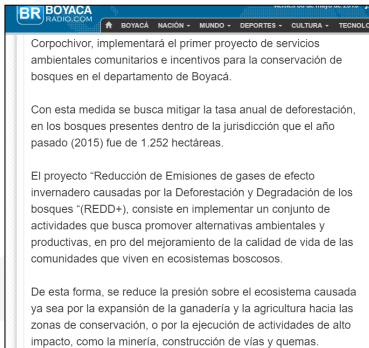
Ilustración 4.