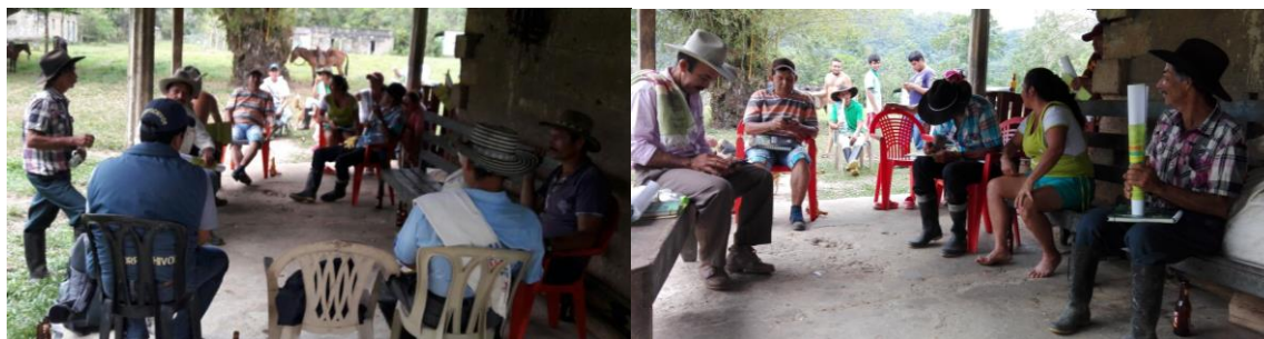
Ilustración 48. Participantes de los talleres – Vereda Nazareth