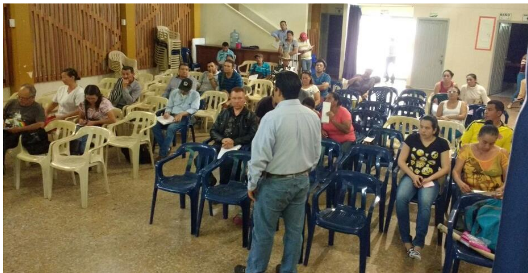
Ilustración 44. Participantes de los talleres – Santa María