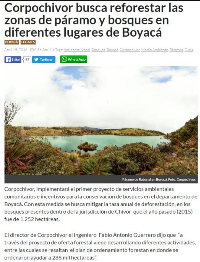
Ilustración 5.