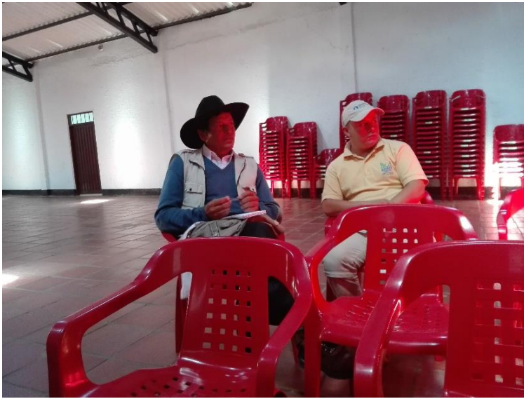
Ilustración 23. Participante de los talleres – Casco Urbano Tibaná