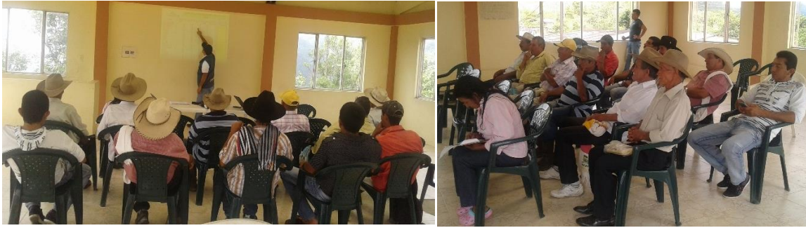
Ilustración 33. Participantes de los talleres – Vereda Vista Hermosa, Agualarga, Yoteguenque