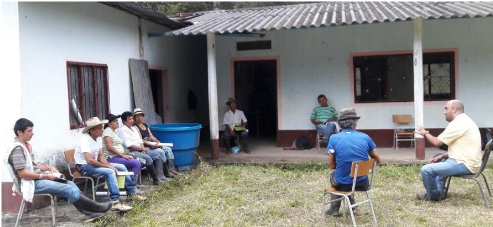
Ilustración 43. Participantes de los talleres – Vedera San Isidro

La reunión de socialización realizada en la vereda de San Isidro tuvo asistencia de 9 personas.