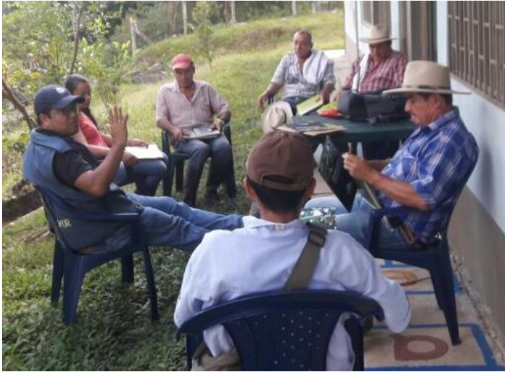
Ilustración 49. Participantes de los talleres – Vereda San Rafael