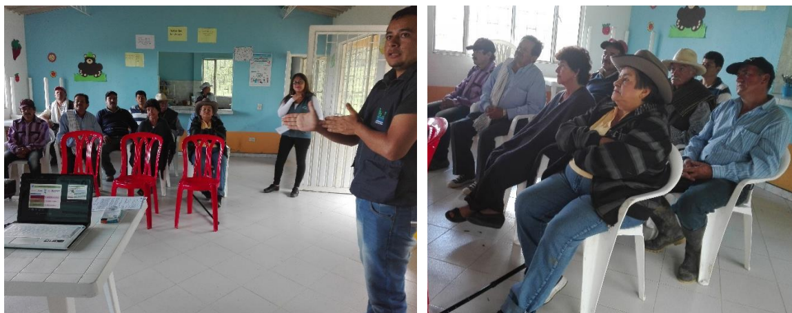
Ilustración 25. Participantes de los talleres – Vereda San Cayetano

Sin embargo, algunos propietarios se mostraron interesados, pero se sintieron cohibidos por la influencia de algunos participantes. En general se considera que la participación de los propietarios en esta zona, estará condicionada a que concluyan o le den alguna respuesta referente al proyecto de delimitación de la Cuchilla San Cayetano.