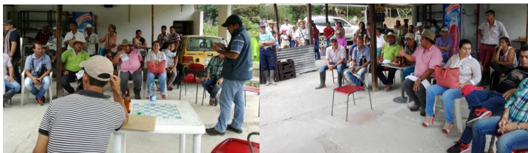
Ilustración 47. Participantes de los talleres – Vereda Ceiba Chiquita.

Hubo asistencia de 34 personas a esta reunión de socialización.