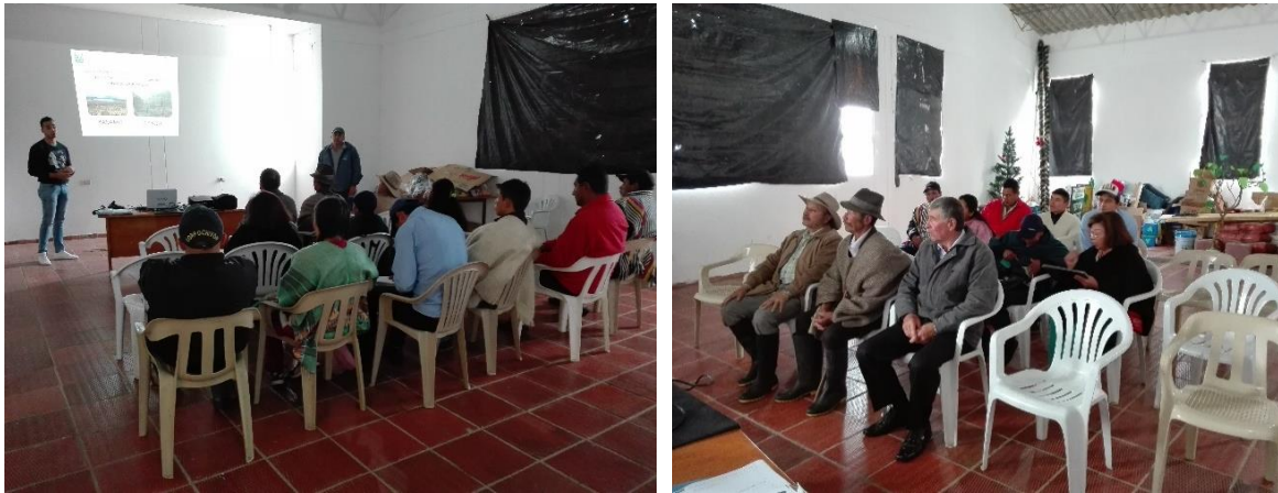
Ilustración 17. Participantes de los talleres – Casco urbano Viracachá