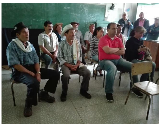
Ilustración 8. Participantes de los talleres – Vereda Fonzaque Arriba