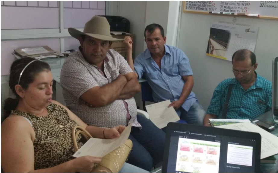
Ilustración 42. Participantes de los talleres – Vedera Balcones