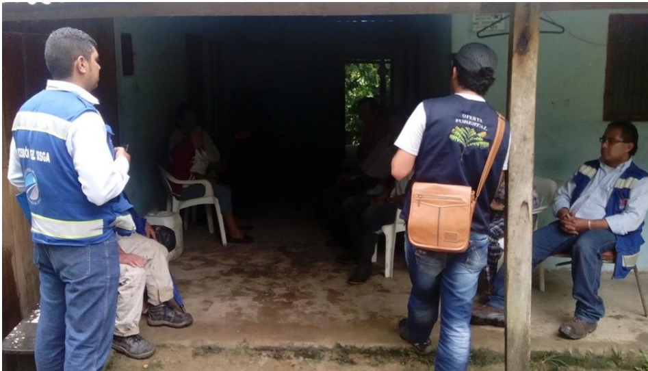
Ilustración 38. Participantes de los talleres – Vereda Arrayanes Arriba

Se firmaron tres cartas de intención correspondientes a un total de 80 ha de predio y 50 ha de bosque, ubicados en esta misma vereda.