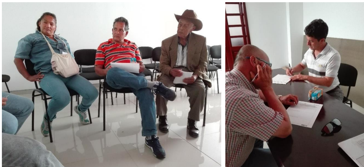
Ilustración 11. Participantes de los talleres – Casco urbano La Capilla

Solo 2 personas firmaron la carta de intención, ambas con predios en la vereda Ubaneca; con un total en conjunto de 53 ha de predio. Cabe mencionar que es necesario realizar las visitas a cada predio para evaluar el área de bosque en cada uno.