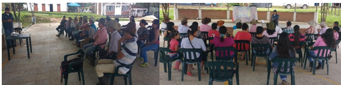
Ilustración 41. Participantes de los talleres – Veredas Caño Tigre, Caño Grande, Río Chiquito, Buenavista y Horizontes

Se logró la firma de una carta de intención correspondiente a 35 ha de predio y 11 ha de bosque.