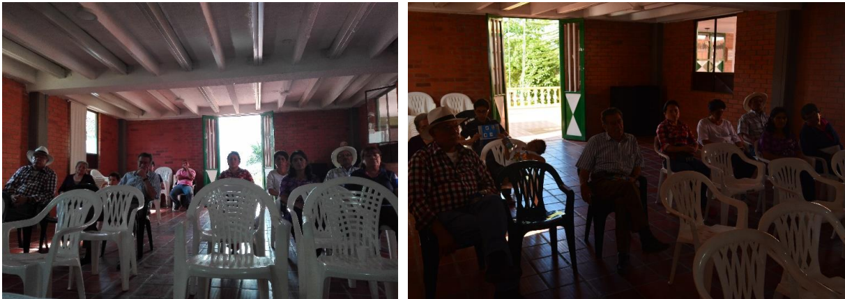
Ilustración. 9 Participantes de los talleres – Casco urbano Guayatá