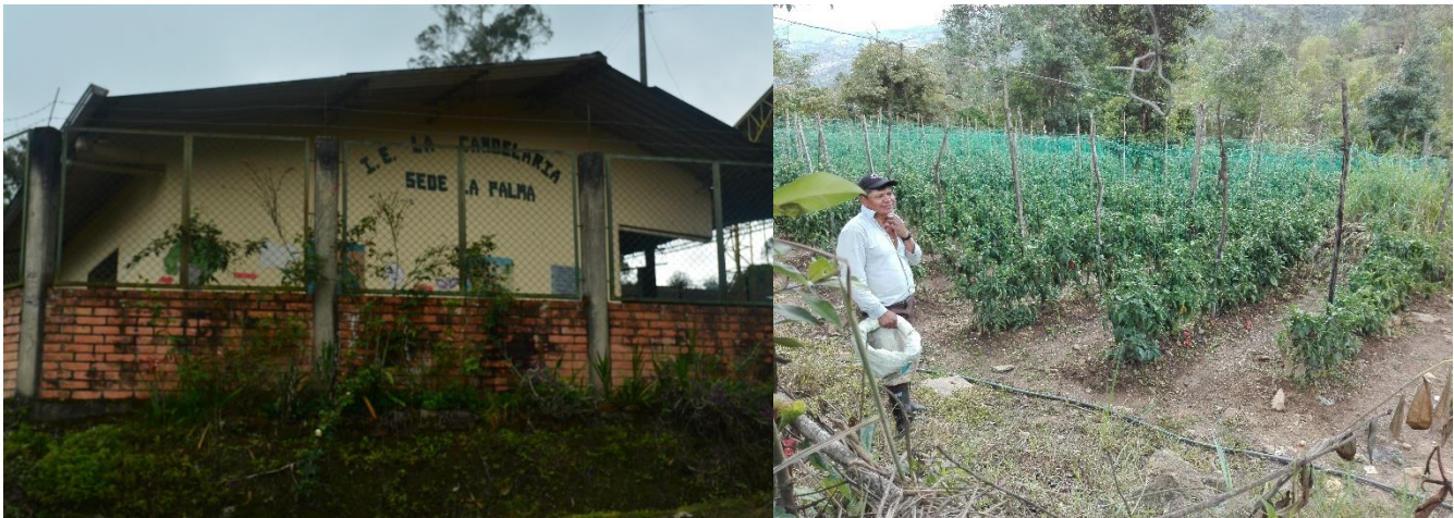
Ilustración 10. Ex presidente veredal en su predio

Se realizó la visita al presidente saliente del periodo 2015 en su predio 10 , el cual solicitó que la próxima reunión se realice teniendo en cuenta los días de mercado en el pueblo, ya que en días de semana los interesados se encuentran trabajando en sus tierras.