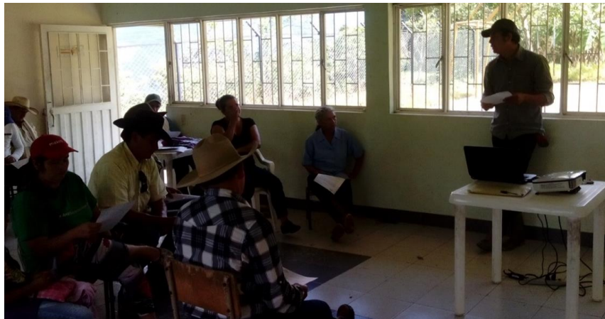
Ilustración 34. Participantes de los talleres – Vereda Puerto Triunfo

Se firmaron dos cartas de intención, de 2 predios de 13 ha y 9,5; con un total de 3,5 ha de bosque.