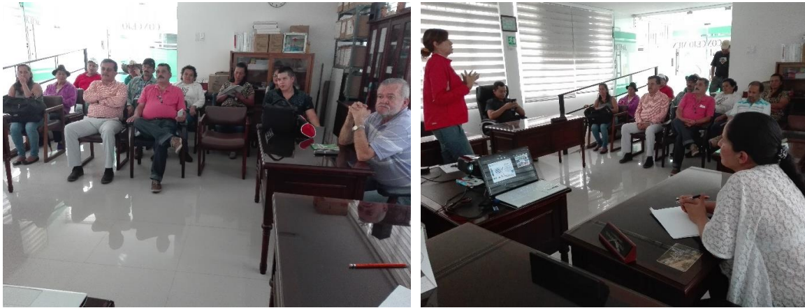
Ilustración 26. Participantes de los talleres – Casco urbano Chivor

Se contó con la asistencia de un participante dedicado a actividades ecoturísticas; el cual indagó sobre el papel de este tipo de actores, teniendo en cuenta que no son propietarios. En general se aclaró que las actividades de proyecto no solo van dirigidas a los propietarios, sino a todos los “actores del bosque”, es decir a aquellas personas que lo puedan impactar positiva o negativamente.