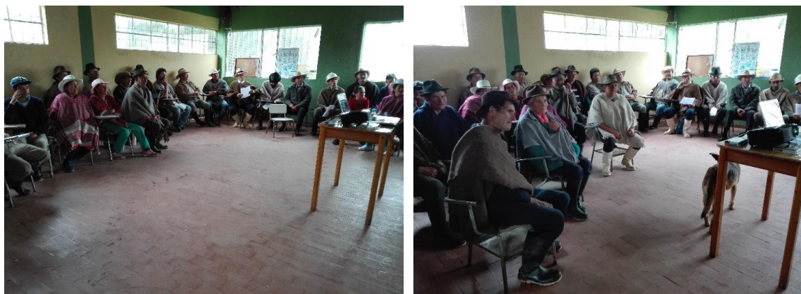
Ilustración 16. Participantes de los talleres – Vereda Caro Alto

Por último, las preguntas van direccionadas hacia el equipo de Corpochivor referente a la instalación de estufas eficientes, y solicitan mayor alcance y continuidad de este proyecto en la vereda. Se recolectaron 22 cartas de intención, con un total de 224 ha; correspondiendo 132,5 ha a bosques y 28 ha a páramos. Dichos predios se encuentran en las veredas Caros, La Isla, Pueblo Viejo, Galindos, Parras y Chen Alto.