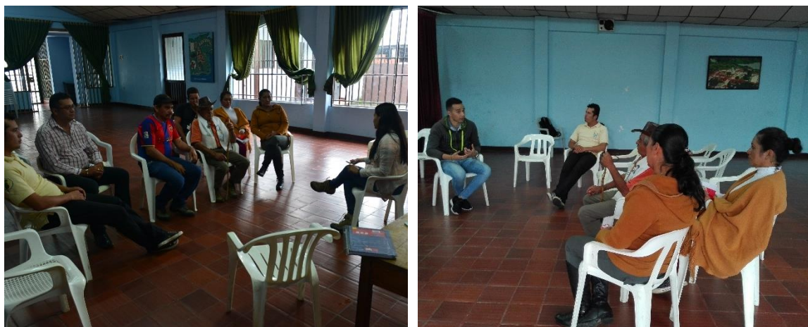
Ilustración 13. Participantes de los talleres – Casco Urbano Macanal

Asimismo, manifestaron gran interés por vender sus tierras a la Corporación; sin embargo, se aclaró que dicha acción no está contemplada en el proyecto y además, está bajo la autoridad de la alcaldía municipal.