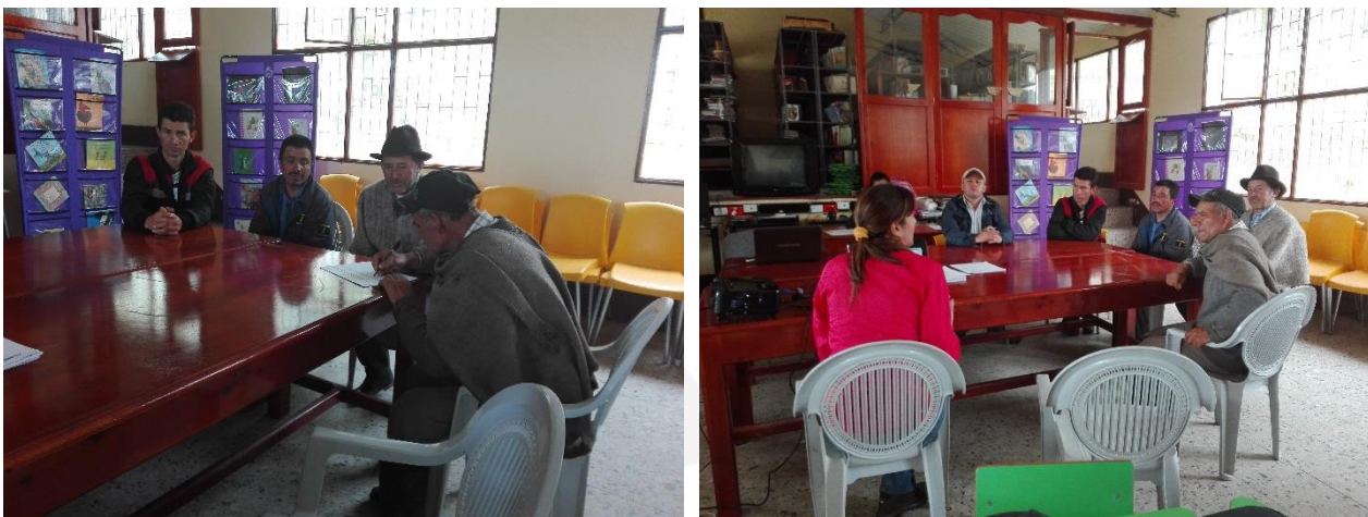
Ilustración 24. Participantes de los talleres – Vereda Bosque

Entre las actividades que resaltan se encuentra la reforestación y asesoría sobre la exoneración o disminución del impuesto predial. Cabe señalar que entre los asistentes se encontraba un concejal, el cual manifestó total apoyo hacia el desarrollo del proyecto.