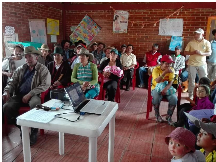
Ilustración 22. Participantes de los talleres – Vereda Quichatoque