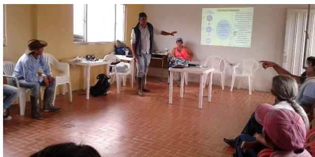
Ilustración 32. Participantes de los talleres – Vereda San Agustín