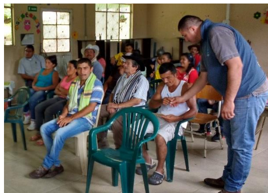
Ilustración 31. Participantes de los talleres – Vereda Guamal