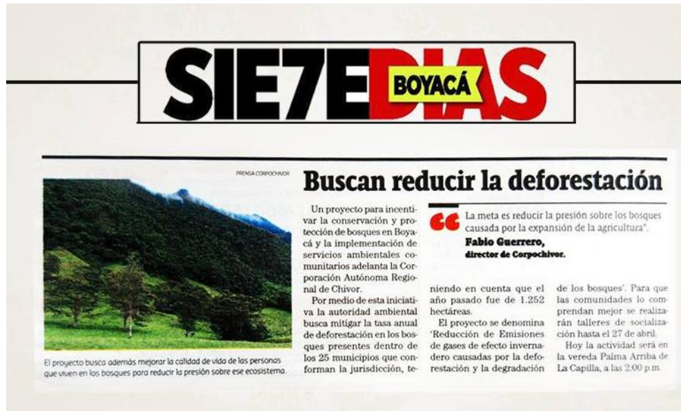
Ilustración 2. Fechas de las socializaciones, Periodico SIE7EDIAS Boyacá (19/04/16)

Al mismo tiempo, la programación de los talleres y otros registros se publicó en diferentes medios departamentales, como emisoras, páginas web de los municipios y de la Corporación.