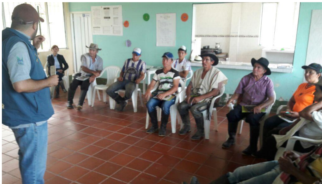
Ilustración 35. Participantes de los talleres – Vereda El Rodeo