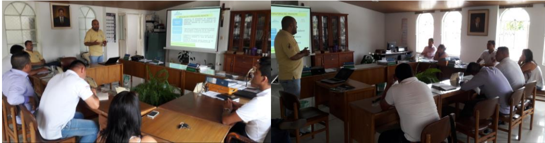
Ilustración 28. Participantes en los talleres – Segunda reunión Casco Urbano Campohermoso.

Se realizó una segunda reunión con miembros del concejo municipal, la cual contó con la asistencia de 9 personas.