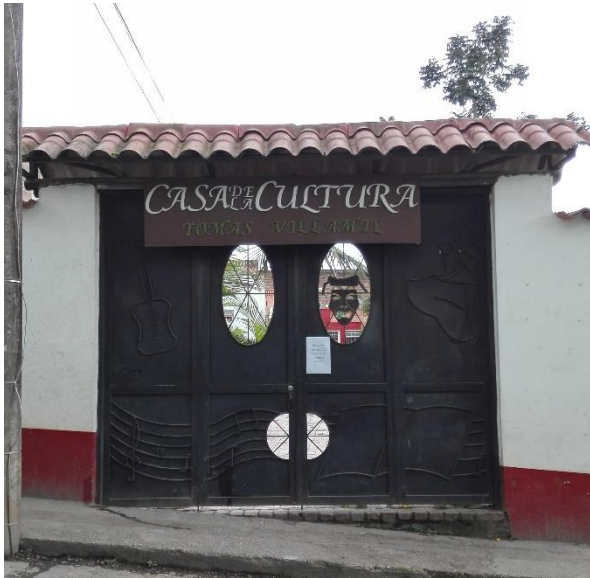
Ilustración 19. Lugar de reunión del taller

No se realizó la reunión en el casco urbano debido al nulo interés de la comunidad en participar (no hubo asistencia). Se tomó en cuenta que el taller fue programado para el día sábado en la tarde; motivo por el cual, las personas no asistieron. Asimismo, se reprogramará el taller teniendo en cuenta los días de mercado en el pueblo.