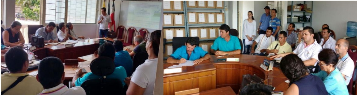
Ilustración 36. Participantes de los talleres – Casco Urbano San Luis de Gaceno