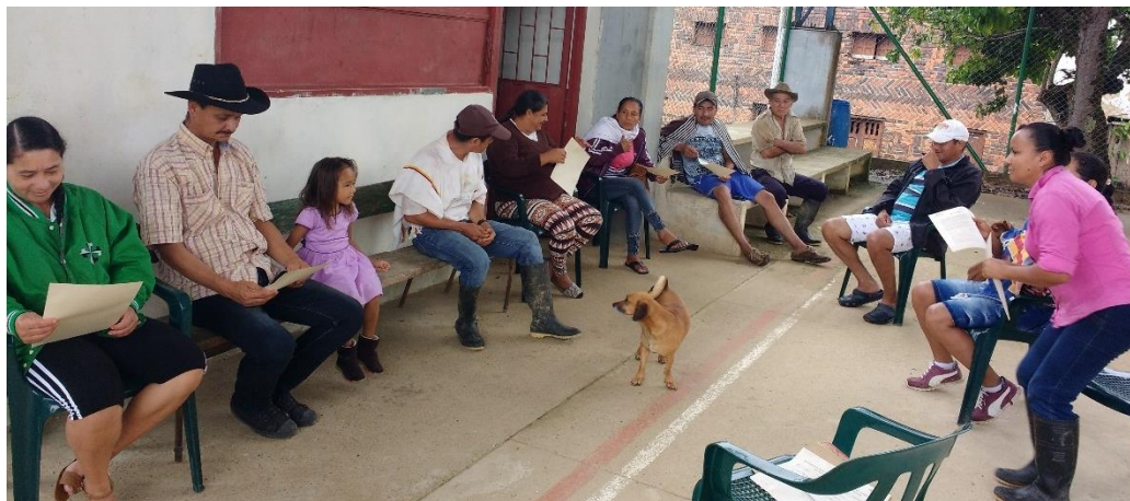
Ilustración 40. Participantes de los talleres – Veredas La Dorada y Guavio

La participación para este taller fue de 11 personas pertenecientes a las veredas La Dorada y el Guavio. El principal comentario es referente al cumplimiento que se espera de la Corporación Corpochivor con los acuerdos comentados durante el taller.