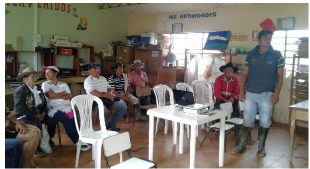
Ilustración 29. Participantes de los talleres – Vereda Agualarga