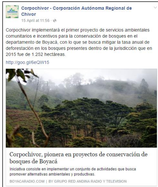
Ilustración 3. Facebook Corpochivor (15/04/16)