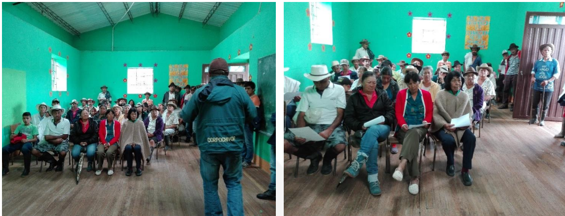
Ilustración 18. Participantes de los talleres – Vereda Guanica Molino

Cabe señalar, que la reunión duró 40 minutos debido a que fue el espacio dado por el presidente comunal, seguidamente tendrían reunión comunal sobre rendición de cuentas.