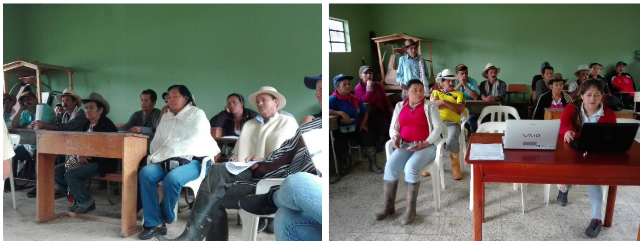
Ilustración 12. Participantes de los talleres – Vereda Guavio